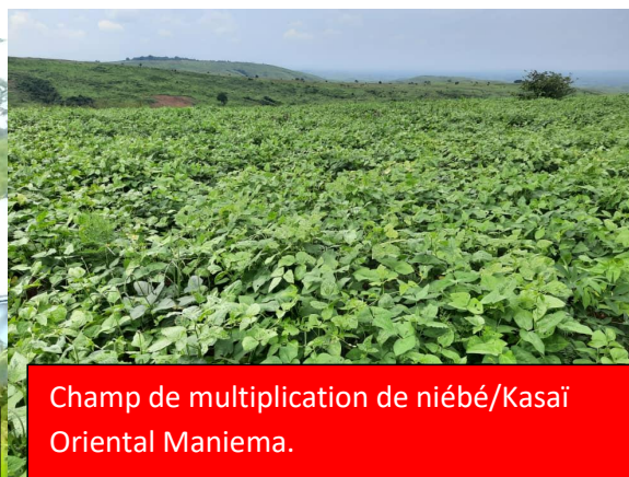
Champ de multiplication de niébé/Kasai Oriental Maniema.

Le projet prévoit d'appuyer 15 960 ménages en 2025, ce qui devrait porter le total des ménages appuyés en semences à mi-parcours à 31 908 ménages (sur 18 620 ménages attendus) soit 171% .