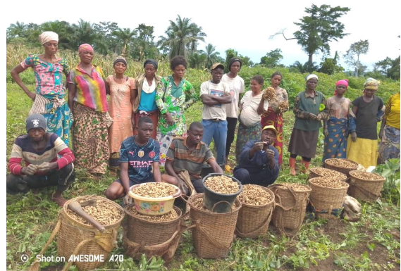
Récolte d'arachide dans un champ de démonstration dans le Territoire de Kasongo, Province de Maniema.

L'activité phare dans le cadre de la promotion des bonnes techniques culturelles est la mise en place des champs de démonstration dans les deux zones et la diffusion dans les ménages pour