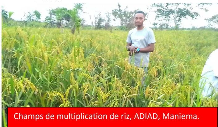
Champs de multiplication de riz, ADIAD, Maniema.

Depuis le début du projet, 15 948 ménages ont bénéficié des semences améliorées des cultures vivrières et maraîchères sur 53 200 cibles fin projet soit un taux de réalisation de ± 28.83% .